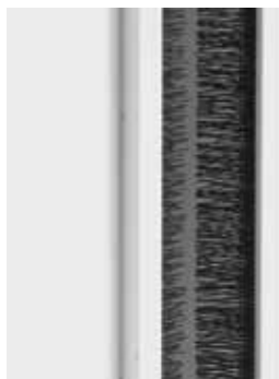
Guide con spazzolino antivento